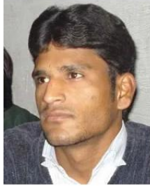
(Representative photo)