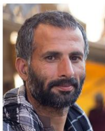
(Representative photo) Send us a photo of this people group