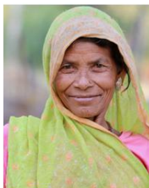
(Representative photo) Photo Source: Kandukuru Nagarjun - Flickr Licensed under CC BY 2.0