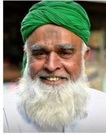
(Representative photo)