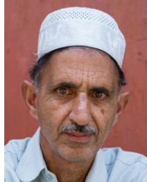
(Representative photo)