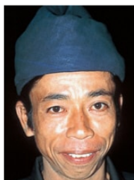
Send us a photo of this people group