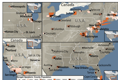
South Asian, Bengali Speaking in U.S.A.

People Group Location from IMB. Other Map Data/Geography from GMM5 (GMI). Map by Joshua Project