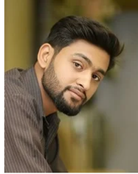
(Representative photo) Send us a photo of this people group