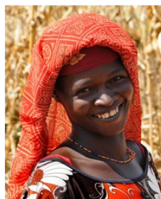
(Representative photo)