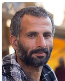
(Representative photo) Send us a photo of this people group