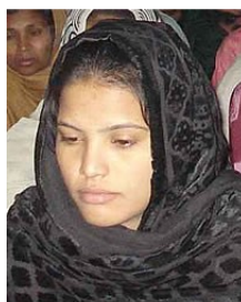
(Representative photo)