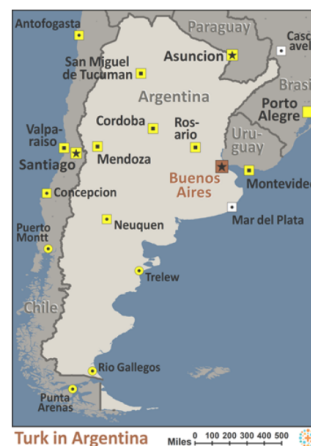
Turk in Argentina Miles 0 100 200 300 400 500