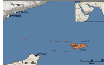
Socotran in Yemen

People Group Location from IMB. Other Map Data/Geography from GMMMS (GMI). Map by Joshua Project