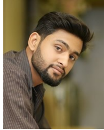
(Representative photo) Send us a photo of this people group