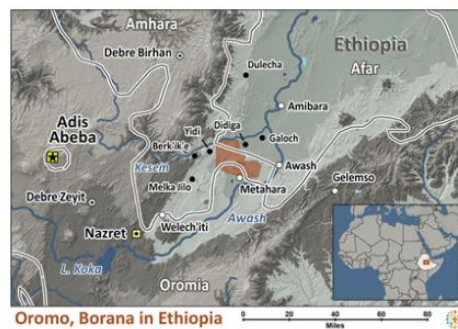
Map Source: People Group location: IMB. Map geography: ESRI / GMI. Map design: Joshua Project.