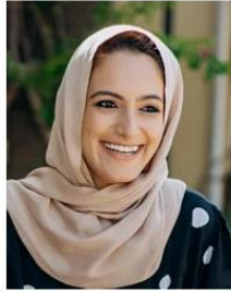
(Representative photo) Send us a photo of this people group