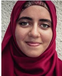
Photo Source: Michal Huniewicz Creative Commons Used with permission Send us a photo of this people group