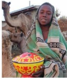
Send us a photo of this people group