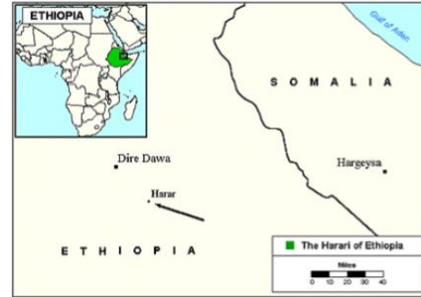
Send us an updated map of this people group