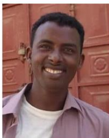
(Representative photo)