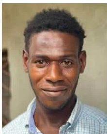
Send us a photo of this people group