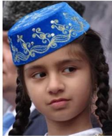
Send us a photo of this people group