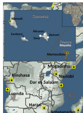
Bushi in Mayotte

Map symbols: ● ○ ● ● ● ● ● ● ● ● ● ● ● ● ● ● ● ●