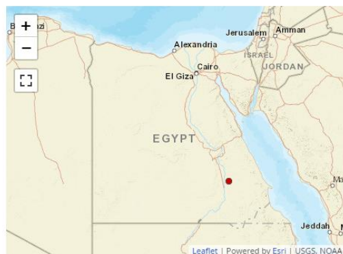
Send us a map of this people group