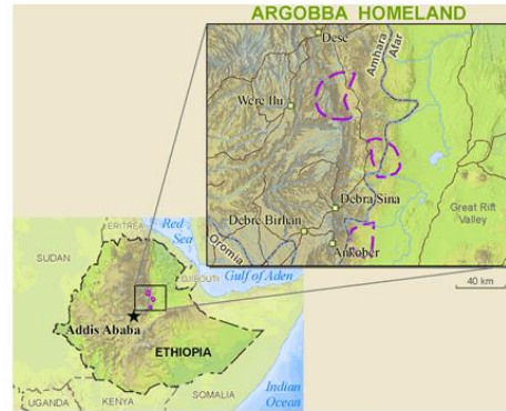
Send us an updated map of this people group