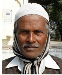
(Representative photo) Send us a photo of this people group