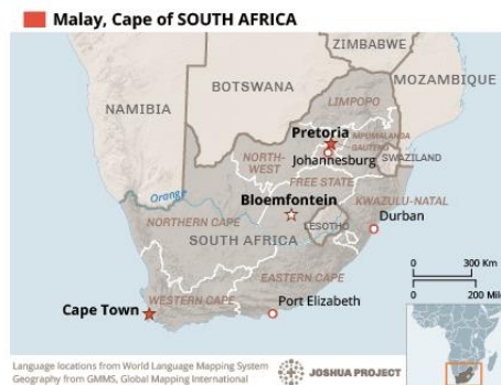
Send us an updated map of this people group