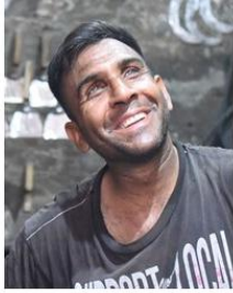
(Representative photo)