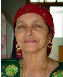
(Representative photo)

The Tidikelt Berber have only been reported in Algeria