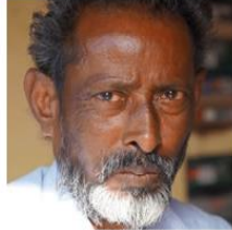
(Representative photo) Send us a photo of this people group