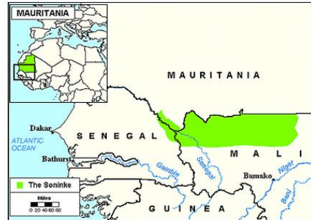
Map Source: Bethany World Prayer Center