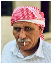
Photo Source: manothegreek Used with permission Send us a photo of this people group