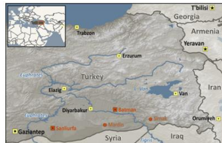
Yazidis in Turkey