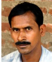
(Representative photo) Send us a photo of this people group

* From latest Pakistan census data. Current Christian values may substantially differ.