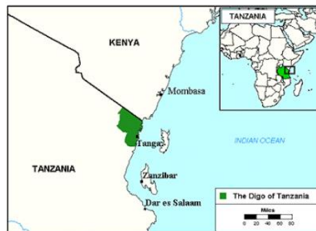
Send us an updated map of this people group