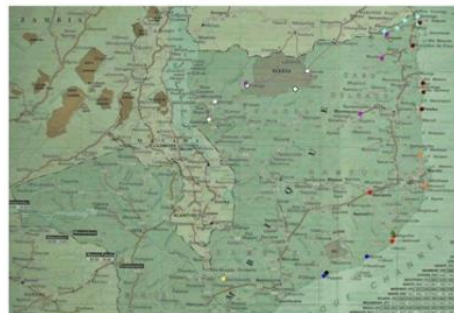
Send us an updated map of this people group