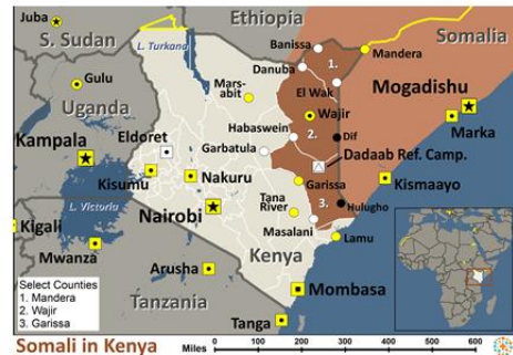
Somali in Kenya