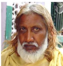
(Representative photo) Photo Source: Copyrighted © 2020 Isudas All rights reserved. Used with permission Send us a photo of this people group

* From latest India census data. Current Christian values may substantially differ.