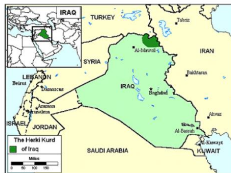
Send us an updated map of this people group