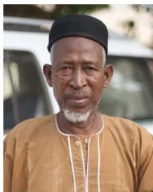
(Representative photo)