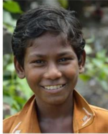
Send us a photo of this people group

* From latest Pakistan census data. Current Christian values may substantially differ.