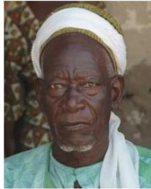
Send us a photo of this people group