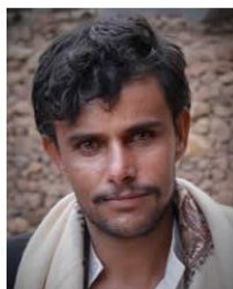
(Representative photo) Photo Source: Rod Waddington - Flickr Licensed under CC BY-SA 2.0