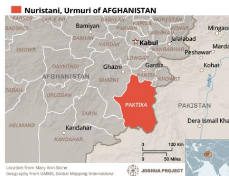
Location from Mary Ann Stone Geography from GMMIS, Global Mapping International

Click the map for a larger PDF version.