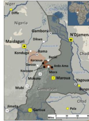
Mandara, Wandala in Cameroon