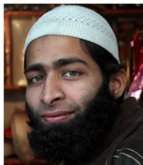
(Representative photo) Send us a photo of this people group