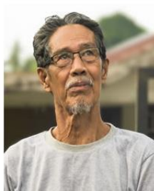
Send us a photo of this people group