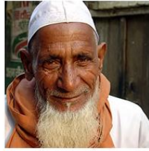
(Representative photo) Send us a photo of this people group