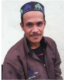
Send us a photo of this people group