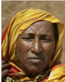
Send us a photo of this people group