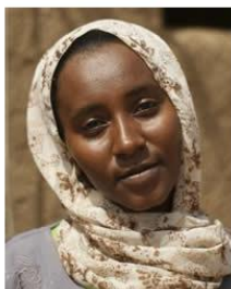
(Representative photo)

The Arabized Shaikia have only been reported in Sudan