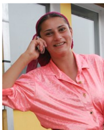
Photo Source: Petar Milošević - Wikimedia Licensed under CC BY-SA 3.0